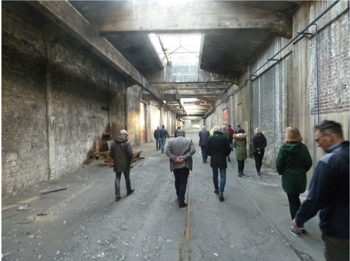
Abb.1 Ortsbegehung Rösler-Areal mit dem Arbeitskreis

Zum Auftakt dieses Austauschs wurden seitens der Moderation die aus den Interviews gewonnenen Erkenntnisse in anonymisierter und aggregierter Form dargestellt. Der anschließende Austausch bestätigte die thematische Schwerpunktsetzung; Klärungsbedarf bestand zunächst vornehmlich zu den Aspekten 'Altlasten' und 'Verkehr'.