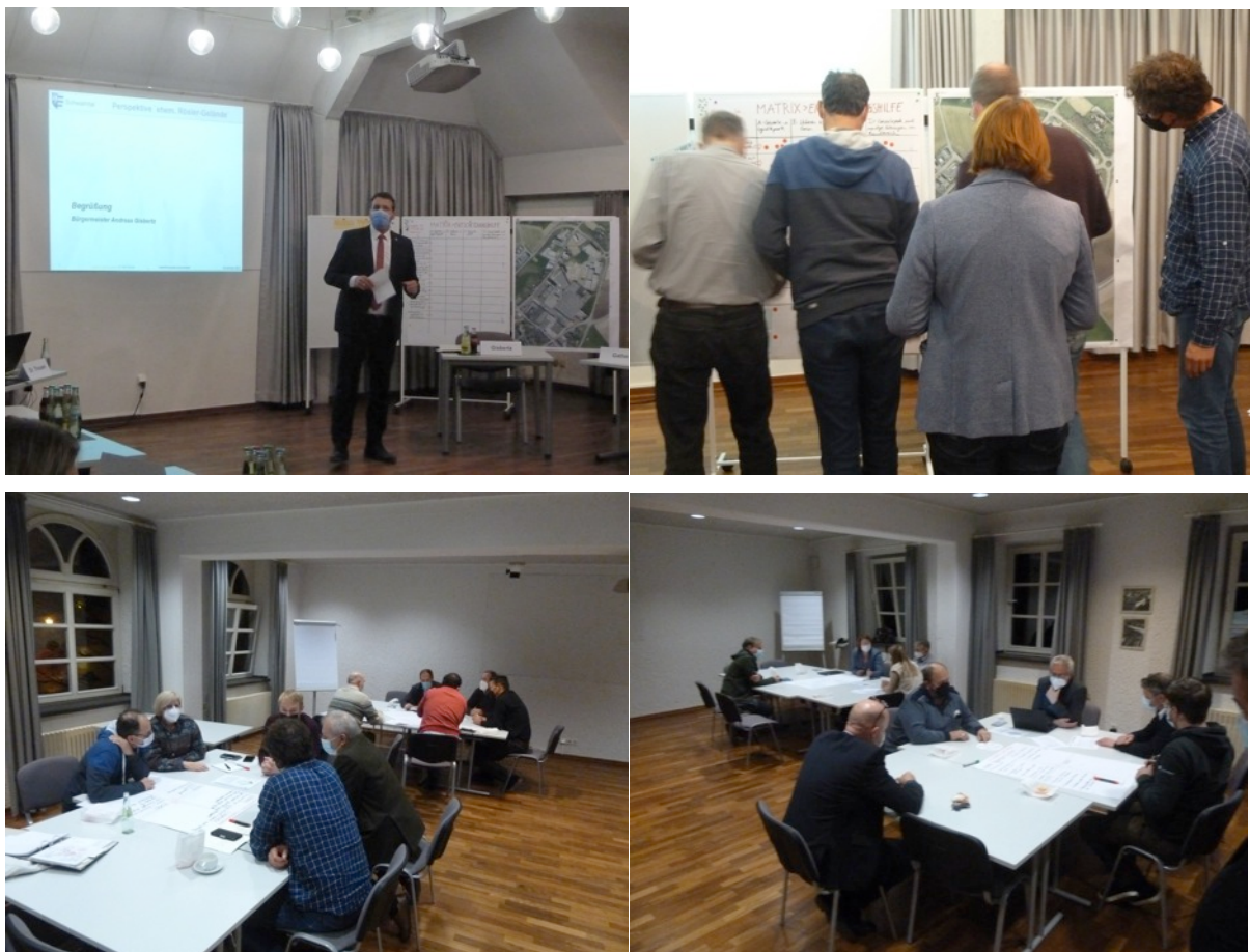
Abb.3 Impressionen aus der 2. Arbeitskreissitzung