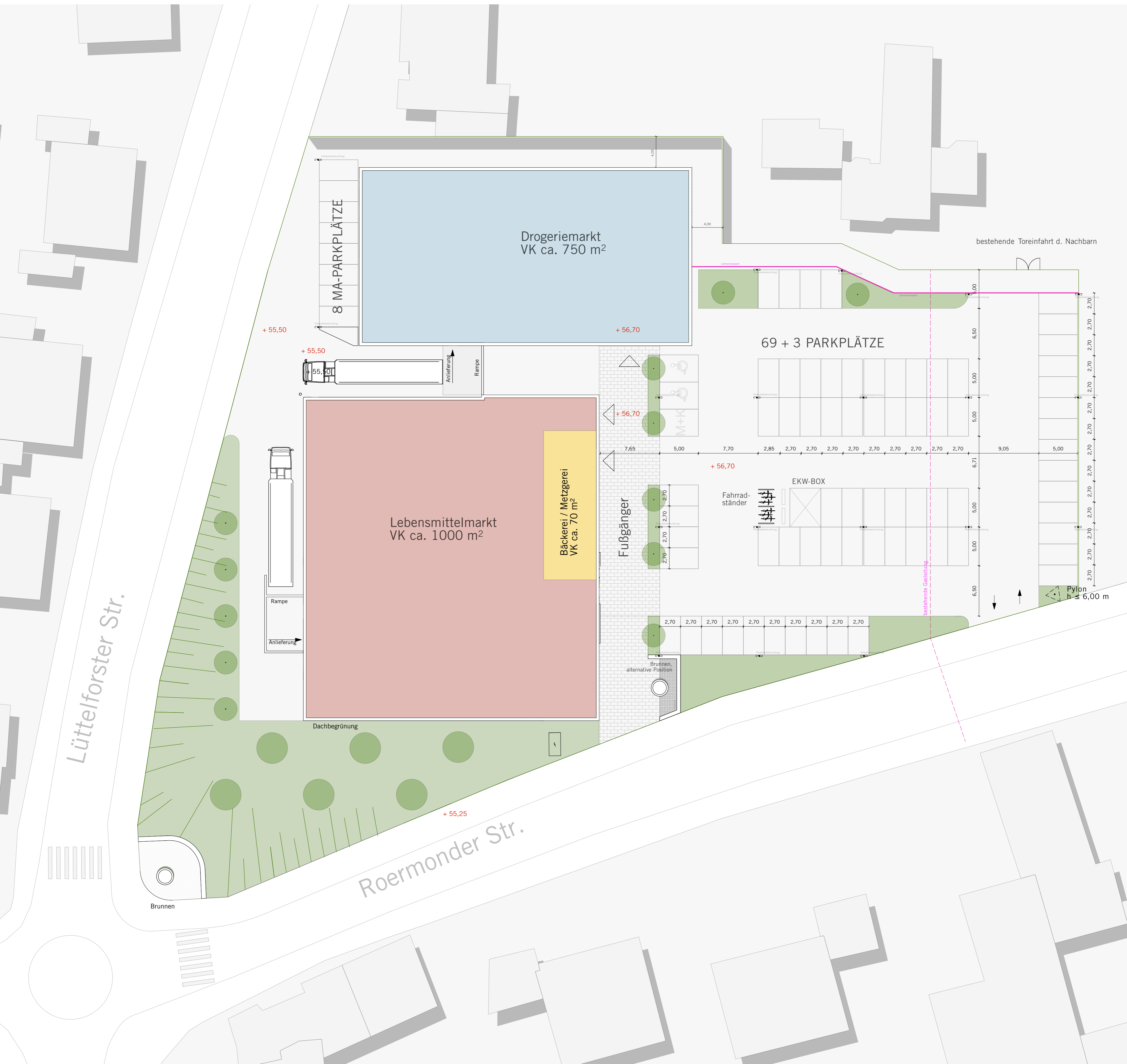
Grundriss | M 1:250

20.11.2017 | 'Ehemalige Schlossbrauerei' Schwalmthal